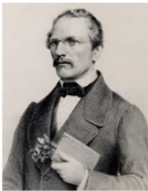
Karel Jaromír Erben